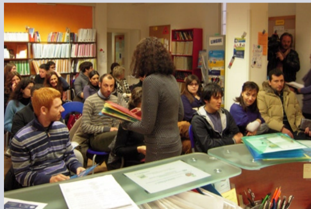
Uno degli appuntamenti Crealmpresa promossi da Cna

Prosegue l'attività gratuita della Cna per l'autoimprenditorialità