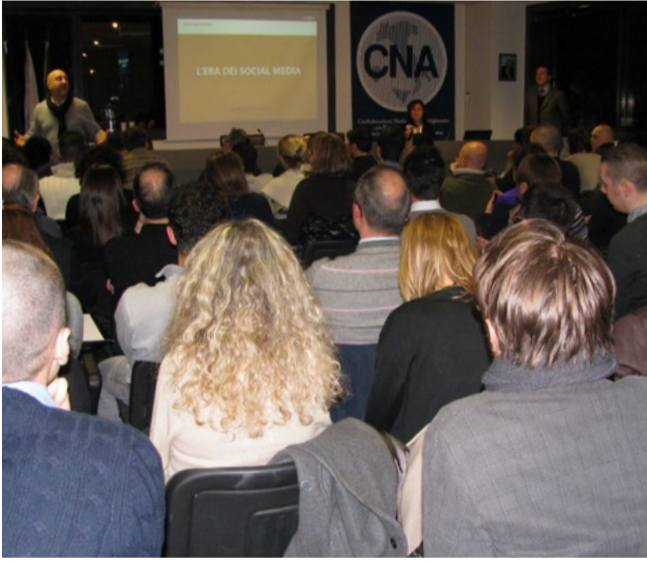
Sala affollata per l'incontro "Fare Business con i Social Media" in CNA

Basti pensare che nel mondo, sono oltre 1 miliardo le persone iscritte a Facebook. In Italia 13 milioni di persone si collegano ogni giorno ai social network, di cui quasi 8 milioni e sempre più spesso da dispositivi mobili (smartphone e tablet). Sono numeri impressionanti ed in crescita costante che evidenziano come la linea di confine, tra la comunicazione offline e online, sia sempre meno nitida. I due mondi sono oramai strettamente interconnessi tra loro. Ecco perché oggi qualsiasi azienda, di piccole, medie o grandi dimensioni, non può esimersi dal capire le dinamiche ed