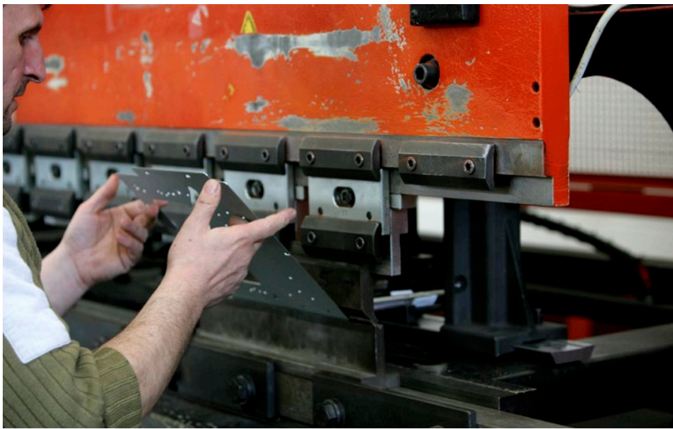
Se non arrivano i fondi per coprire le ore di cassa integrazione in deroga, si aprirà la strada al dramma di centinaia di licenziamenti

Una vera e propria bomba ad orologeria che è pronta ad esplodere anche sul sistema produttivo marchigiano. Dopo il blocco dei fondi per le casse integrazioni in deroga (che coprono i dipendenti delle imprese artigiane in difficoltà, privi della cassa integrazione ordinaria), se il problema non sarà risolto, si prospetta un'ondata di